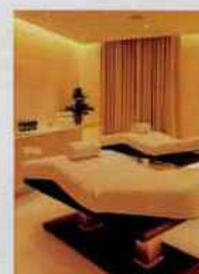
HÔTEL BARRIÈRE LE NORMANDY À Deauville