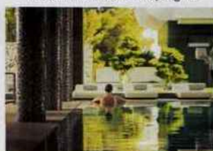
SHA WELLNESS CLINIC Près d'Alicante, en Espagne