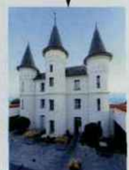
RELAIS THALASSO LES TOURELLES À Pornichet