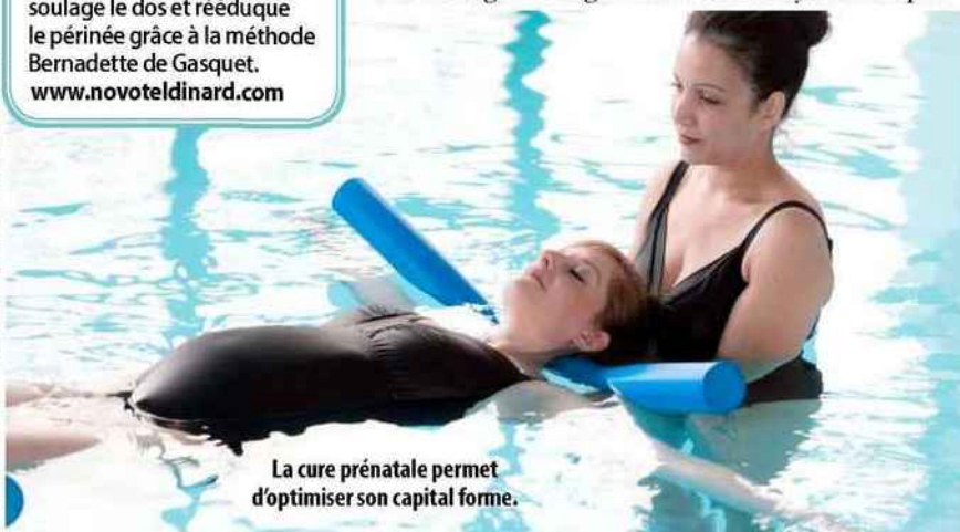
La cure prénatale permet d'optimiser son capital forme.

Avant l'accouchement, les cures thermales et de thalassothérapie intègrent des ateliers de gym posturale, des soins antistress ou des exercices pour soulager le dos. Elles s'effectuent pendant le deuxième trimestre de la grossesse. Lors des séjours pour jeunes mamans, les centres de thalasso ont des chambres équipées pour recevoir le bébé, gardé en alternance par l'accompagnant. Objectif : réveiller les muscles qui ont fondu, rééduquer le périnée, drainer et reminéraliser l'organisme grâce aux soins d'hydrothérapie.