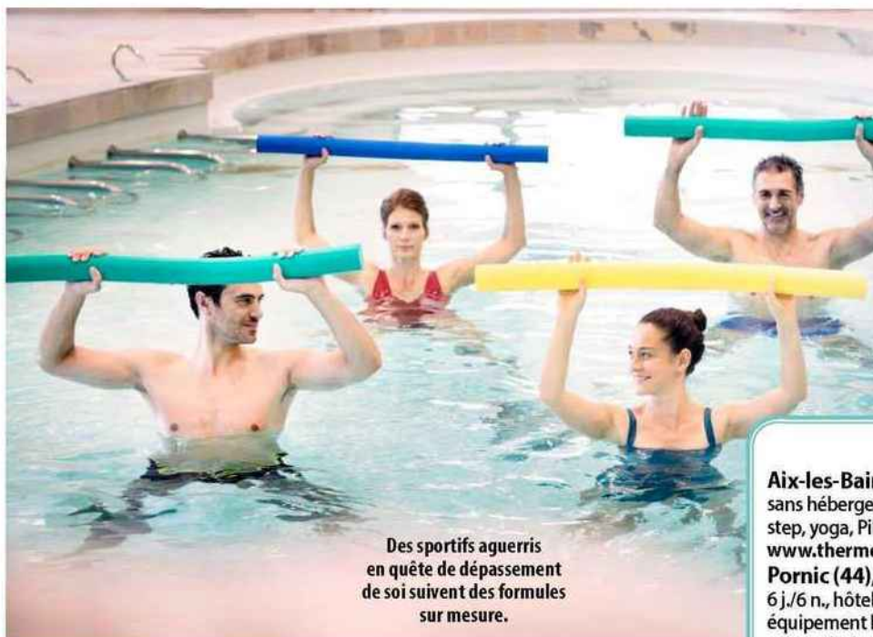
Des sportifs aguerris en quête de dépassement de soi suivent des formules sur mesure.