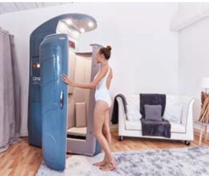
Cabine de cryothérapie